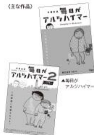
▲毎日がアルツハイマー2