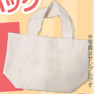
※写真はサンプルです