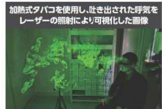
加熱式タバコの煙は見えにくいですが、受動喫煙を発生させ、その煙が健康に影響を及ぼす可能性は否定できません。