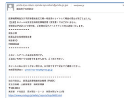
※実際の画面とは異なる場合があります

皆さまからの報告を起点に、厚生労働省、PMDA、製造販売業者など、医療にかかわる人たちが報告情報を活用することで、日本の医療を支えています。