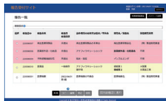
◀報告書登録済みの場合