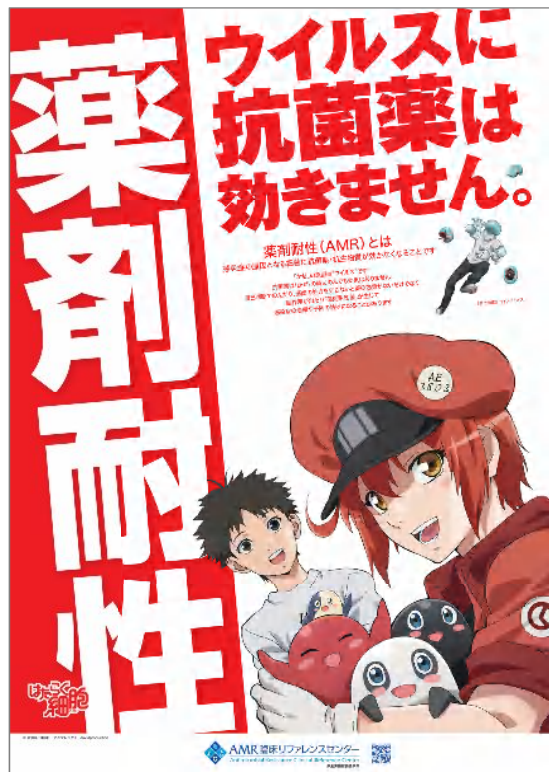
ポスター (B3 364×515mm)

毎年好評のTVアニメ「はたらく細胞」を使ったAMR対策キャンペーン啓発資材です。 薬局へ来局された方へ配布していただき、薬剤耐性(AMR)の啓発にお役立てください。 啓発資材配布にご協力いただける方は、↓コチラのURL・QRコードからお申し込みください。